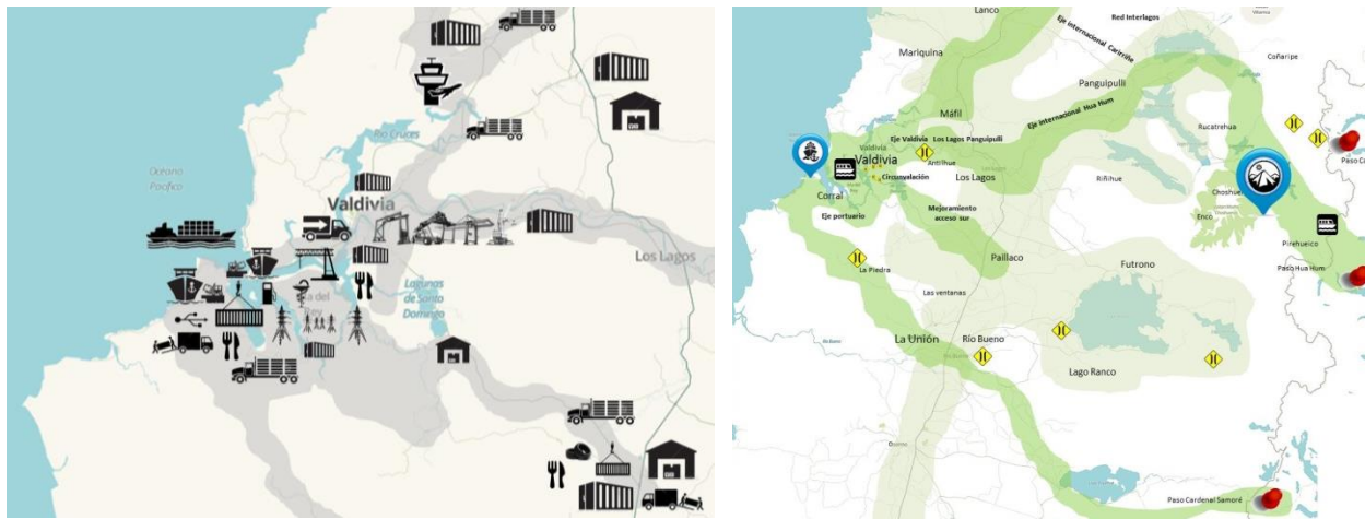
Sistema portuario Corral y área de influencia

Establecer una estrategia de desarrollo e inversión público privada en torno al desarrollo portuario territorial asociado al puerto de Corral y su área de influencia territorial como un sistema logístico integrado, que promueva la puesta en valor de un sistema portuario de carácter regional, relevando sus oportunidades, capacidades y potencialidades, estableciendo criterios que permitan planificar y programar una cartera de inversiones que materialicen el desarrollo de distintos proyectos, incorporando aspectos tales como estructura, localización y objetivos, entre otros.